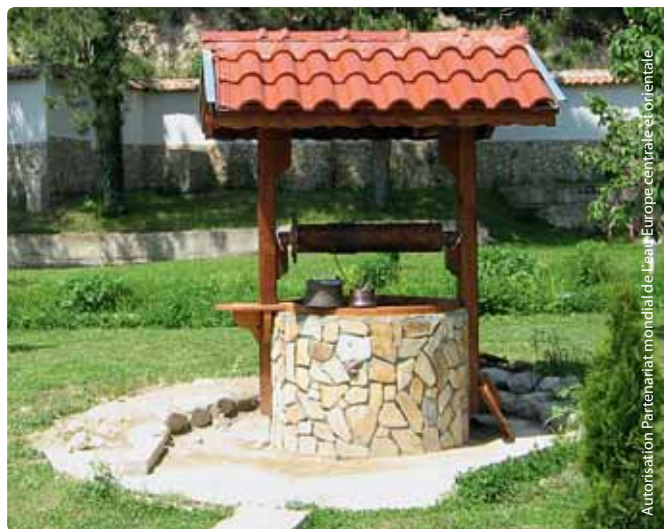
Autorisation Partenariat mondial de l'eau Europe centrale et orientale