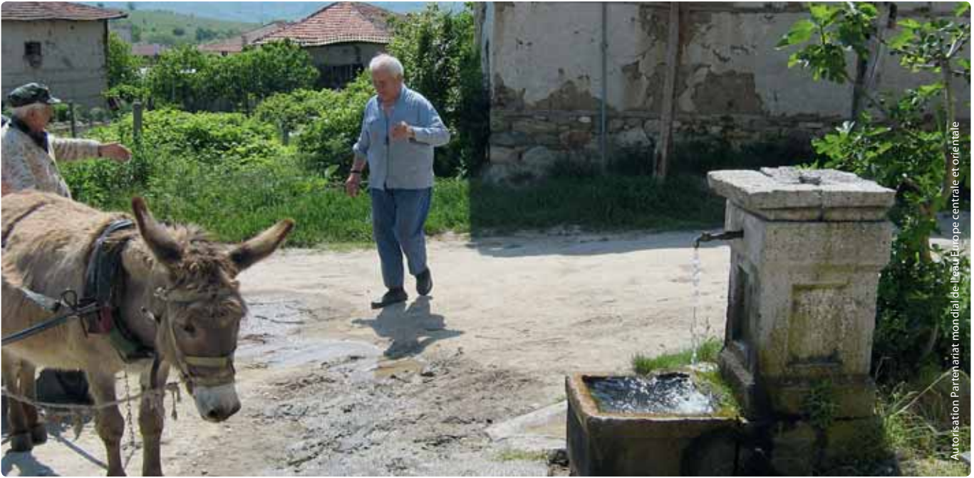
Autorisation Partenariat mondial de l'eau Europe centrale et orientale

Même dans les pays qui, d'après les statistiques, n'auraient aucun problème d'accès à l'eau et à l'assainissement, des sous-sections réduites de population (ce qui représente des millions de personnes à l'échelle paneuropéenne) sont confrontées à de réels obstacles.