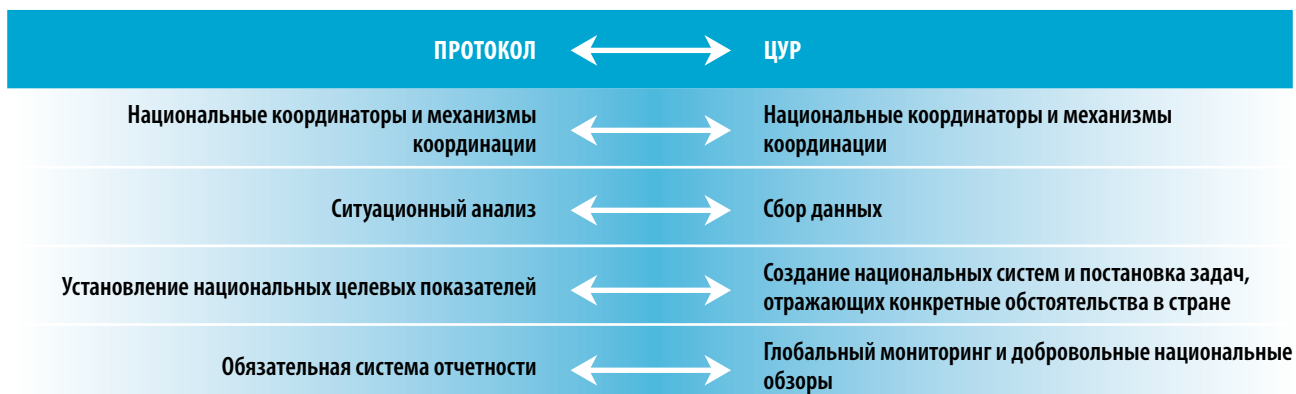
Рис. 5. Соответствие процедурных аспектов Протокола по проблемам воды и здоровья и ЦУР

У Протокола и Повестки дня на период до 2030 года имеется также несколько общих процедурных характеристик, показанных на рис. 5.