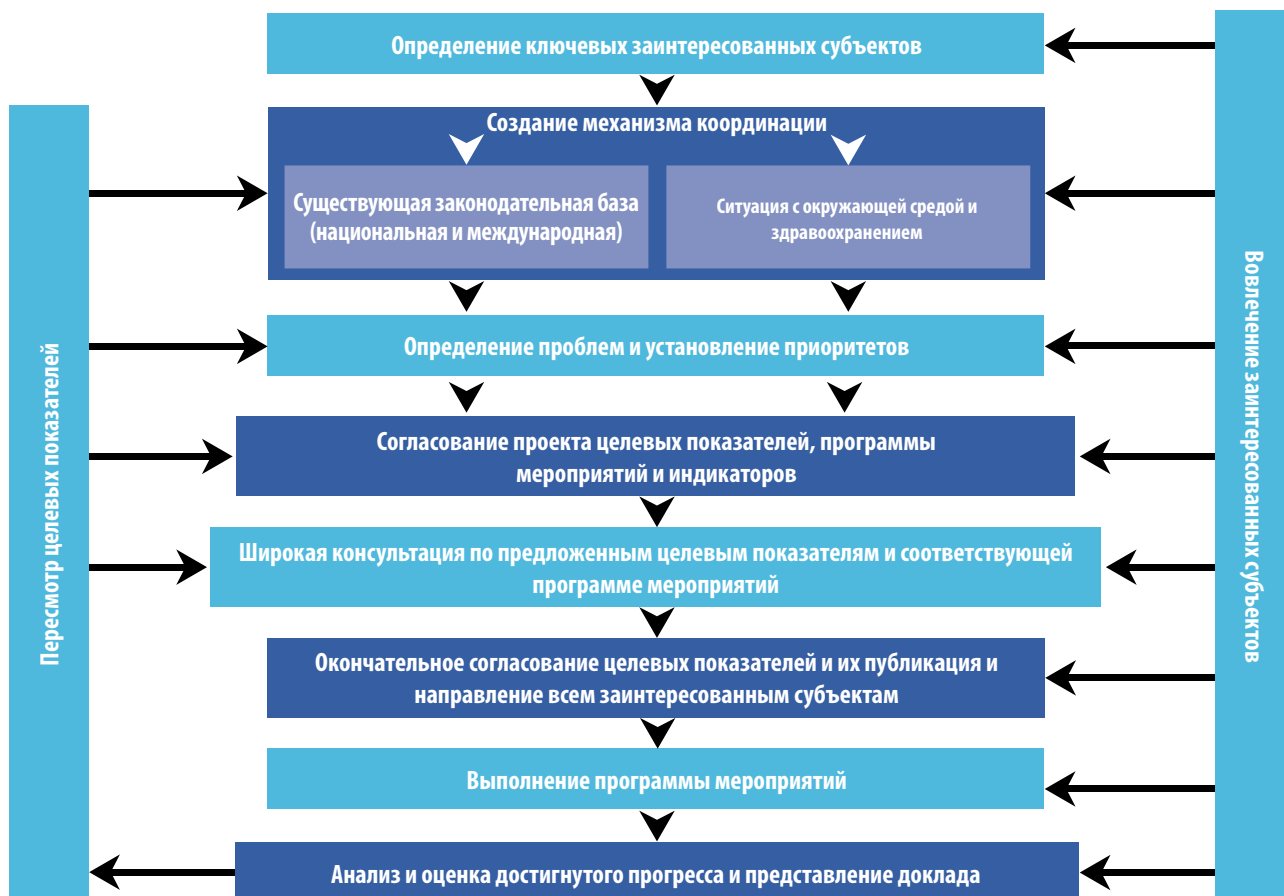
Рис. 8. Процесс установления целевых показателей в соответствии с Протоколом по проблемам воды и здоровья