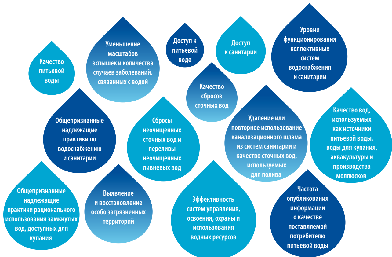
Рис. 1. Целевые области в соответствии с Протоколом

В соответствии со статьей 7 Протокола, каждая страна должна собирать и оценивать данные, касающиеся прогресса в достижении целевых показателей, а также данные о показателях, предназначенных для того, чтобы показывать, как этот прогресс способствовал профилактике, ограничению или сокращению степени распространения заболеваний, связанных с водой. Страны готовят национальные краткие доклады и представляют их раз в три года на совещании Сторон Протокола.