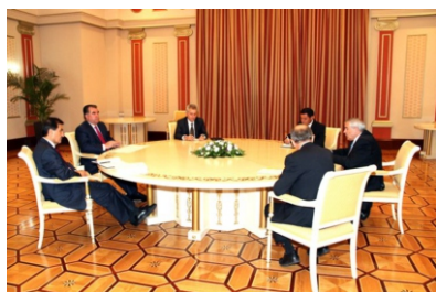
Свен Алкалай на встрече с Президентом Таджикистана Эмомали Рахмоном