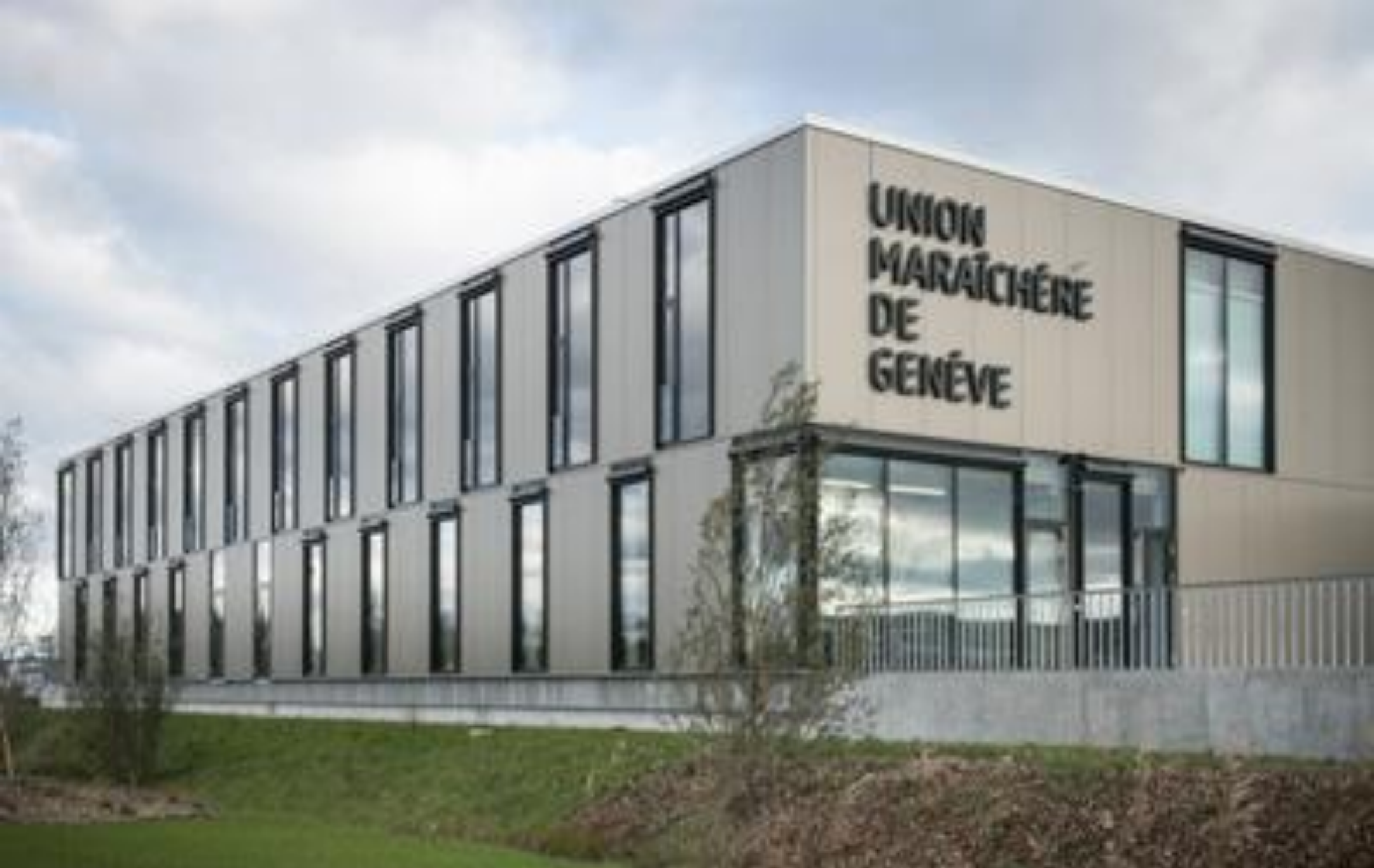
UNION MARAÎCHÈRE DE GENEVE