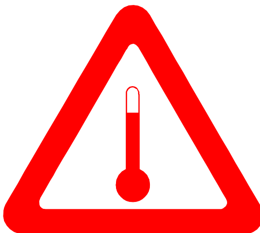
Figura 5.3.4 Rótulo para el transporte a temperatura elevada

Las unidades de transporte que contengan una sustancia en estado líquido que se transporte o se presente para el transporte a una temperatura igual o superior a 100 °C o una sustancia sólida que se transporte o se presente para el transporte a una temperatura igual o superior a 240 °C, llevarán en cada lado y en cada extremo la marca indicada en la figura 5.3.4. Esta marca de forma triangular tendrá lados de 250 mm por lo menos y será de color rojo.