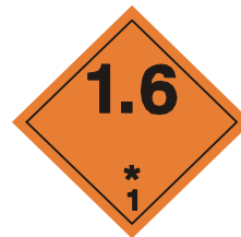
(No.1.6) División 1.6

Fondo: anaranjado; cifras: negro; Los números tendrán aproximadamente 30 mm de altura x 5 mm de anchura (en las etiquetas de 100 mm x 100 mm); cifra "1" en el ángulo inferior