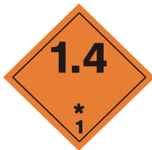
(No.1.4) División 1.4

Símbolo (bomba explotando): negro; Fondo: anaranjado; cifra "1" en el ángulo inferior