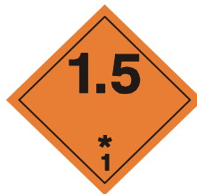
(No.1.5) División 1.5