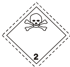
(No.2.3) División 2.3 Gases tóxicos

Símbolo (calavera y tibias cruzadas): negro; Fondo: blanco; cifra "2" en el ángulo inferior