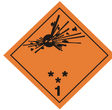
(No.1) Divisiones 1.1, 1.2 y 1.3

Símbolo (bomba explotando): negro; Fondo: anaranjado; cifra "1" en el ángulo inferior