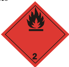
(No.2.1) División 2.1