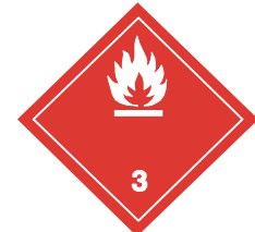
(No.3) Símbolo (llama): negro o blanco; Fondo: rojo; cifra "3" en el ángulo inferior