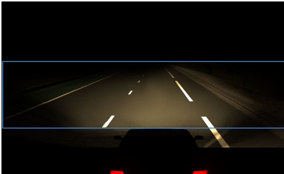
Figure 2. Flux lumineux dans le champ de vision: 265 lumens

6. En outre, afin d'assurer un éclairage conforme aux exigences en matière de sécurité, une nouvelle prescription est ajoutée concernant le flux lumineux minimum du projecteur dans le champ de vision avant (voir illustration ci-après).