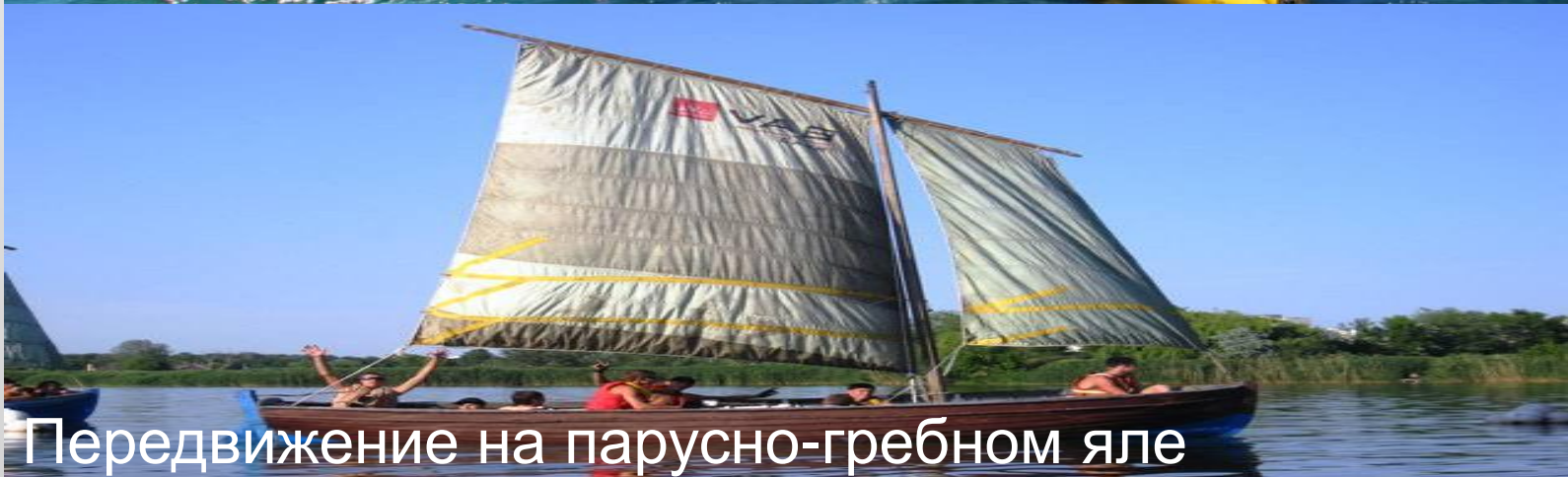
Передвижение на парусно-гребном яле