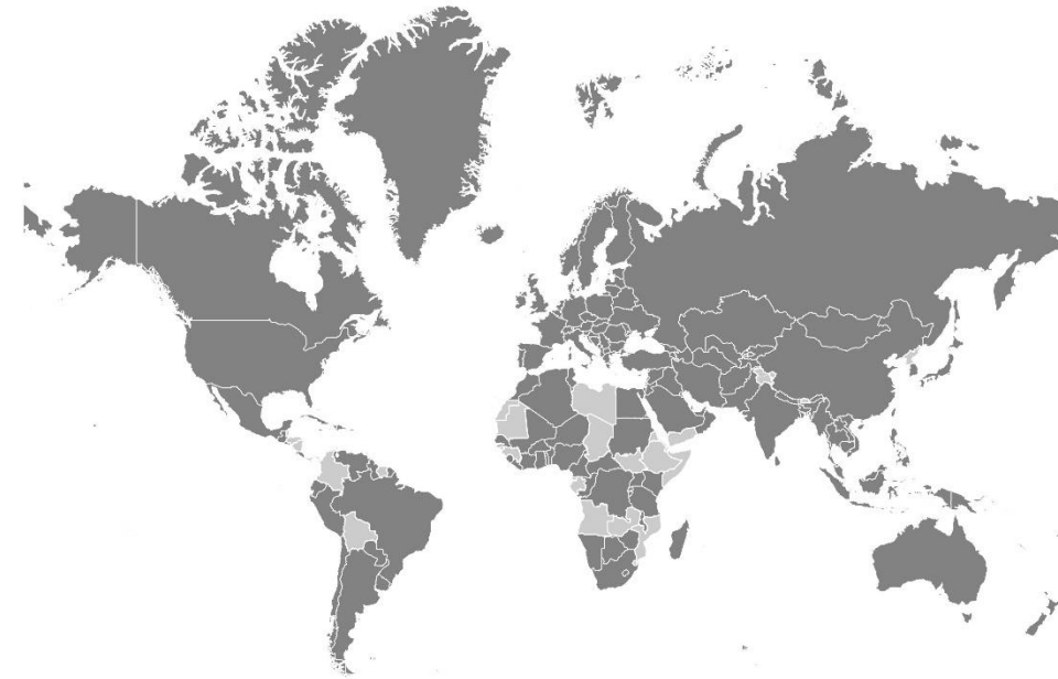
Рис. III Договаривающиеся стороны – члены и нечлены ЕЭК, которые являются договаривающимися сторонами по крайней мере одной конвенции по транспорту Организации Объединенных Наций

Условные обозначения: темно-серый цвет: договаривающиеся стороны; светло-серый цвет: страны, не являющиеся договаривающимися сторонами.