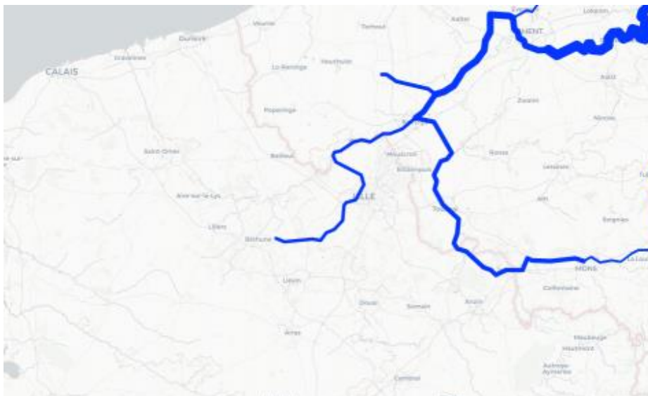
Рис. 2 Франция, Нор – Па-де-Кале — объемы перевозок по ВВП согласно смоделированной карте, 2020 год