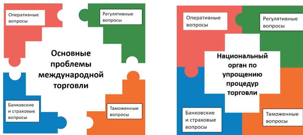
Диаграмма 1. Ряд вопросов международной торговли может быть сложным для торгового сообщества. Национальный орган по упрощению процедур торговли может помочь согласованному решению этих вопросов.