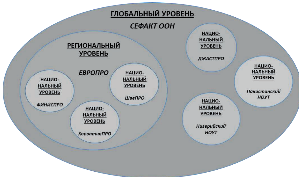
Диаграмма 4. Координация национальных органов по упрощению процедур торговли на региональном и глобальном уровне.

48. Иллюстрация регионального и глобального уровня и (или) структуры НОУТ (аналогичная диаграмме по организации НОУТ, представленной выше в тексте руководства) воспроизводится ниже.